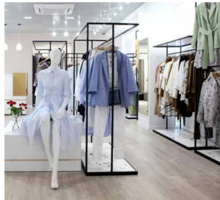
USI COMMERCIALI | COMMERCIAL USE