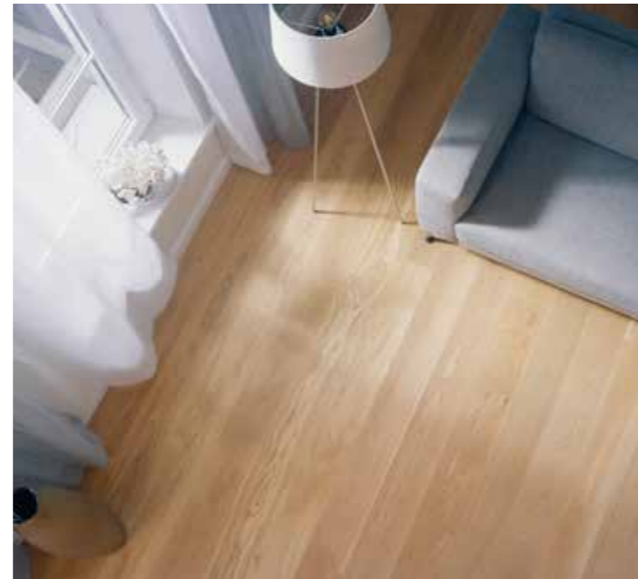
USO DOMESTICO | DOMESTIC USE