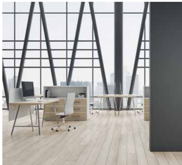
HOTEL - CONTRACT - UFFICI | OFFICES