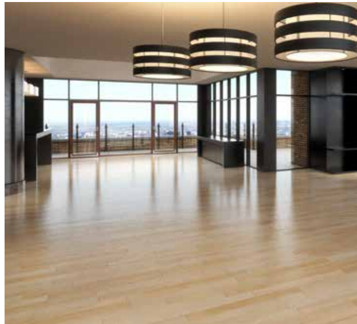
GRANDI FABBRICATI | LARGE BUILDINGS

The unparalleled sophistication of real oak flooring is R.B.S's defining characteristic. Fully aware of the value of sustainability and environmental conservation , the manufacturer company has decided that R.B.S will use only oak from FSC® certified forests.